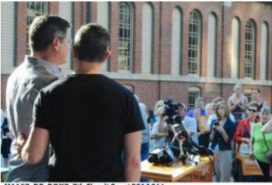
M1157_DP_BOX7_7th Circuit Court 2014 066